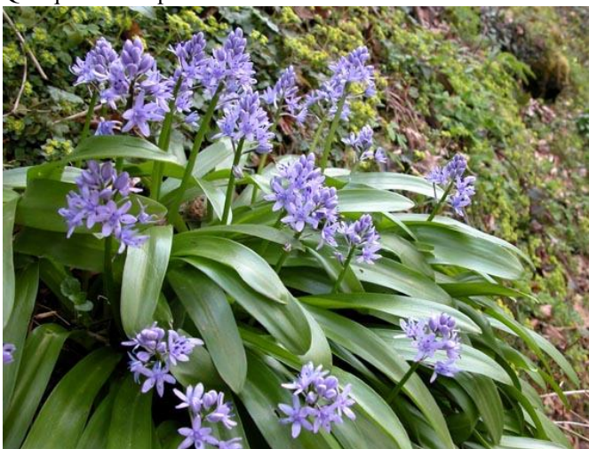
Scille-lis-jacinthe ( Tractema lilio-hyacinthus )

Quelques fleurs printanières attirent notre attention :