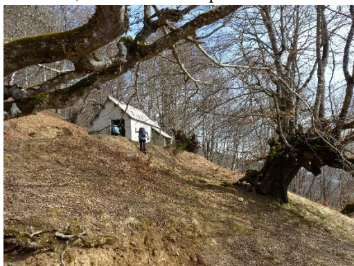
Cabane du Couret de Soulagnech

Le groupe au complet suit la large piste remontant en lisière du bois de la Réouère ; ici, les hêtres sont absolument majestueux, avec des troncs noueux énormes ; heureusement les feuilles ne sont pas encore sorties et nous pouvons admirer la chaîne enneigée. La cabane promise par Joel tarde un peu à apparaître ; nous avons faim (normal après 1h30 de marche...); une petite pause sera la bienvenue. Nous traversons une zone d'avalanche (des arbres ont même été emportés), et bientôt la cabane tant attendue du Couret de Soulagnech nous surplombe, mais ce n'est pas l'objectif du jour et nous poursuivons notre effort. La zone du Clot d'Estiouère, un peu marécageuse, nous oblige à passer un peu à l'écart de la piste. Une grande clairière nous permet d'admirer quelques sommets de la Barousse. Les sous-bois de hêtres sont piquetés de fleurs mauves, la fameuse « dent de chien », avec ses feuilles panachées.