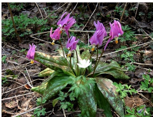
Dent-de-chien ( Erythronium dens-canis )

La semaine précédente, tout était recouvert de neige, mais maintenant c'est pratiquement tout dégagé et la montée s'effectue sans problème.