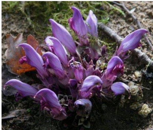
Clandestine ( Lathraea clandestina )

Toutes deux se rencontrent plutôt dans les zones humides, au bord de petits ruisseaux. A noter : toutes les parties de la scille sont toxiques .