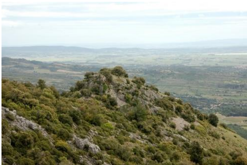
Le moulin de Biot