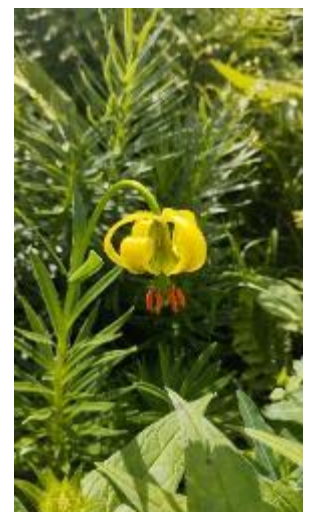
Lis des Pyrénées